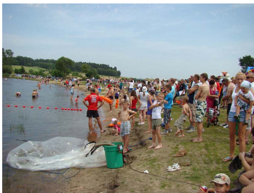
Zdjęcia: Powitanie lata nad jeziorem Szkotowskim.