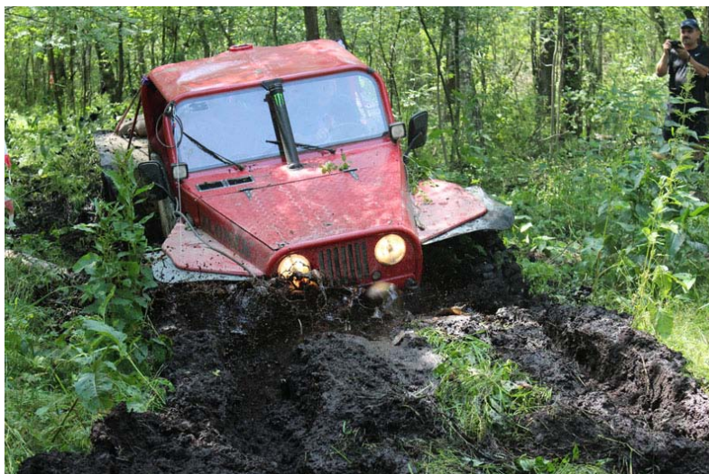
Zdjęcie: Rajd samochodów terenowych.

Na uwagę zasługuje również impreza, która odbyła się w setną rocznicę wybuchu I wojny światowej. Na polach szkotowskich ponad 200 rekonstruktorów z różnych krajów wzięło udział w inscenizacji bitwy pod Tannenbergiem z 1914 roku. Walki z udziałem piechoty, kawalerii i artylerii obejrzało kilka tysięcy widzów.