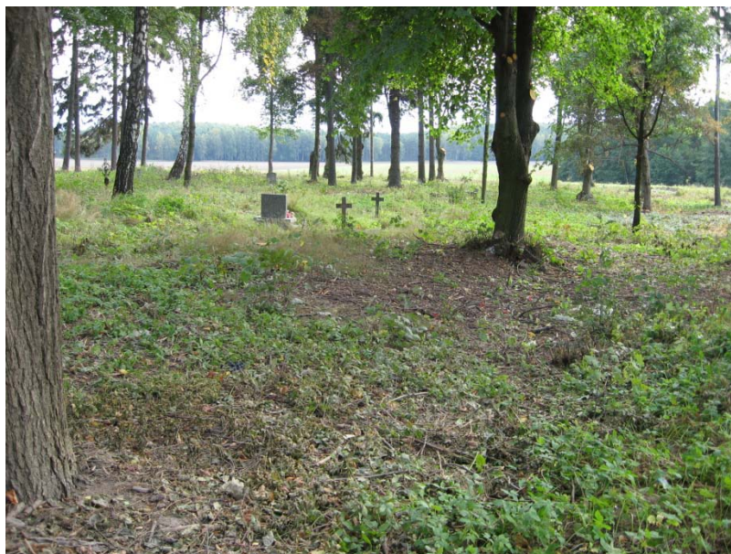
Zdjęcie: Cmentarz z okresu I wojny światowej w miejscowości Szkotowo.