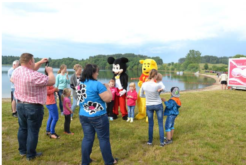
Zdjęcie: Powitanie lata nad jeziorem Szkotowskim.