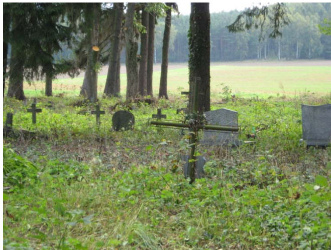
Zdjęcia: Cmentarz z okresu I wojny światowej w miejscowości Szkotowo