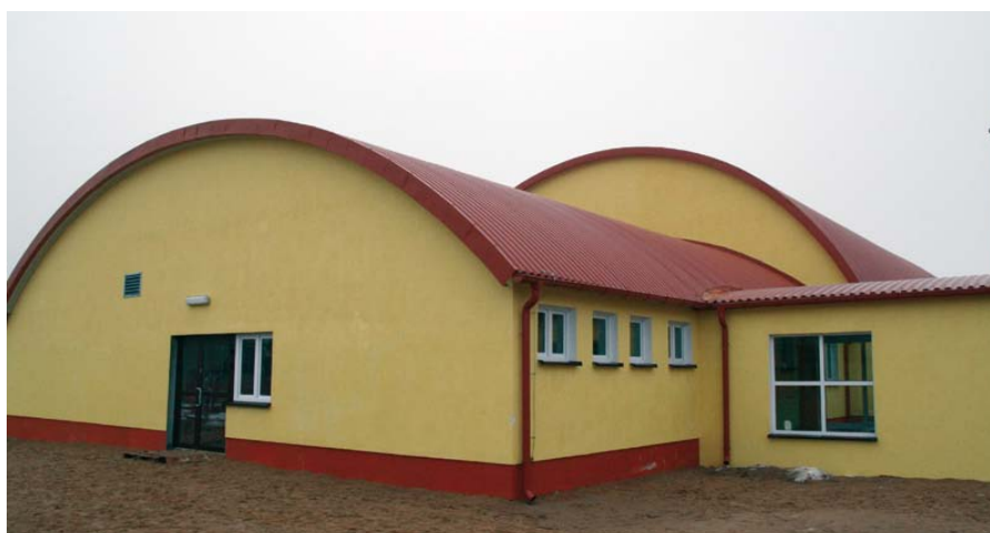
Zdjęcie: Hala sportowa w Szkotowie.

Na terenie miejscowości znajduje się jezioro, które jest wspaniałym miejscem dla miłośników wędkarstwa. W sezonie letnim jezioro bardzo chętnie odwiedzane jest przez turystów lubiących zażywać słonecznych i wodnych kąpeli ze względu na czystą plażę i łagodne dno jeziora.