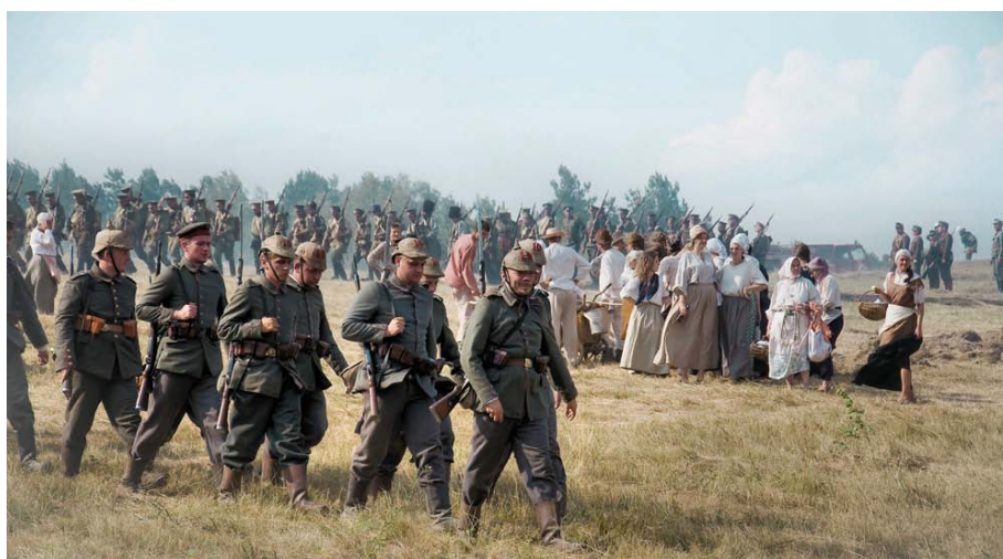
Zdjęcie: Bitwa pod Tannenbergiem.

Na uwagę zasługuje również impreza, która odbyła się w setną rocznicę wybuchu I wojny światowej. Na polach szkotowskich ponad 200 rekonstruktorów z różnych krajów wzięło udział w inscenizacji bitwy pod Tannenbergiem z 1914 roku. Walki z udziałem piechoty, kawalerii i artylerii obejrzało kilka tysięcy widzów.