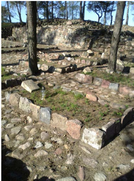
Zdjęcie: Cmentarz z okresu I wojny światowej w miejscowości Szkotowo.

Do zabytków należy również neobarokowy dwór z początku XX wieku wraz z otoczeniem oraz cmentarze wojenne z okresu I wojny światowej.