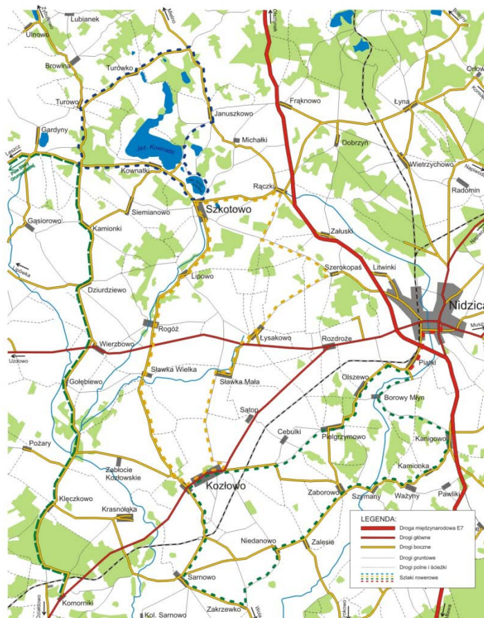
Mapa: Mapa szlaków rowerowych w gminie Kozłowo.

Przez miejscowość Szkotowo przebiegają szlaki rowerowe oraz szlak kajakowy.