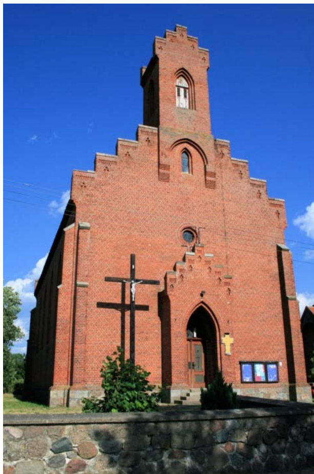
Zdjęcie: Kościół w miejscowości Szkotowo.

Na terenie miejscowości znajdują się historyczne ślady obiektów mających ważne znaczenie kulturowe. Wśród nich można wyróżnić XIX – wieczne młyny, które występują w postaci stanowisk archeologicznych.