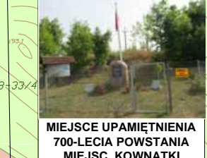
MIEJSCE UPAMIĘTNIENIA 700-LECIA POWSTANIA MIEJSC. KOWNATKI