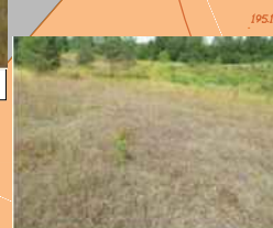
OBSZAR WYSTĘPOWANIA KOCANKI PIASKOWEJ