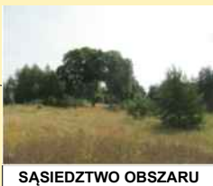
SĄSIEDZTWO OBSZARU OPRACOWANIA