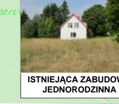
ISTNIEJĄCA ZABUDOWA JEDNORODZINNA