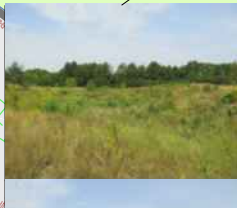
TEREN NIEWIELKIEJ SKARPY