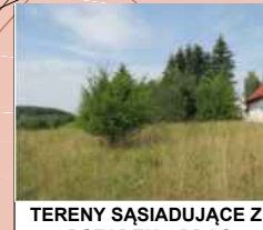
TERENY SĄSIADUJĄCE Z OBSZAREM OPRAC.