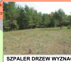
SZPALER DRZEW WYZNACZAJĄCY GRANICĘ DZIAŁKI SĄSIEDNIEJ