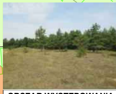
OBSZAR WYSTĘPOWANIA KOCANKI PIASKOWEJ