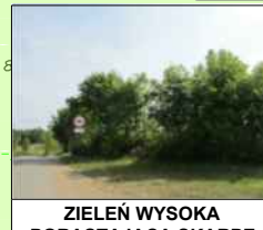
ZIELEN WYSOKA PORASTAJĄCA SKARPE